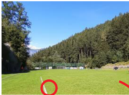
SPORTPLATZ ALDRANS Naturrasen

Beliebte Treffpunkte für Groß und Klein aus der Region rund um den Patscherkofel: