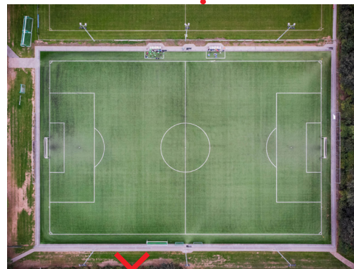
TRAININGSPLATZ AMPASS Naturrasen