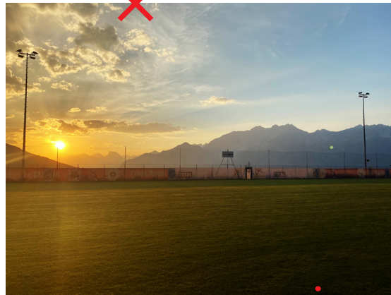
SPORTPLATZ PATSCH Naturrasen