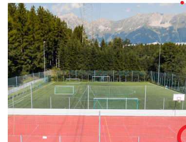
TRAININGSPLATZ LANS Kunstrasen